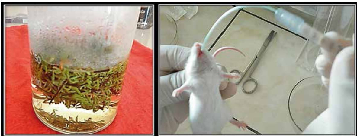
Figura 4. Infuso de Pellaea ternifolia a 200 mg/Kg, 5. Inoculación por vía orogástrica del infuso de "cuti – cuti" a ratones Mus musculus cepa Balb/c.