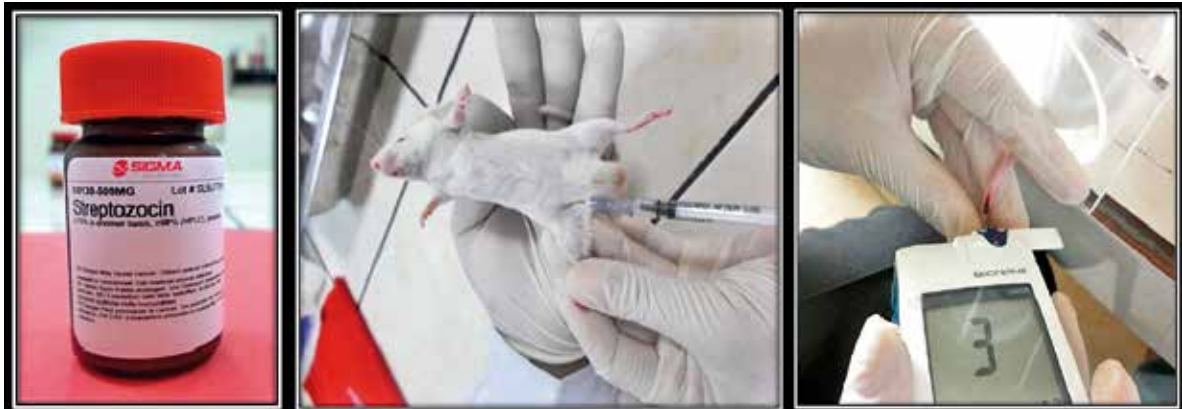
Figura 1. Agente diabotogénico, 2. Inducción de hiperglicemia por vía intraperitoneal a ratones Mus musculus cepa Balb/c, 3. Medición por vía intracaudal utilizando glucómetro digital marca Bionime GM300.

Para observar los efectos del Cuti – cuti sobre la glicemia normal, ambos grupos de 10 ratones cada uno recibieron 60 y 70 mg/Kg de estreptozotocina, vía intraperitoneal, para inducir hiperglicemia experimental. Posteriormente, el grupo I recibió suero fisiológico y el grupo II, Cuti – cuti a la dosis de 1 mL durante una semana de tratamiento; controlándose la glicemia a los 0, 60, 120, 180 y 240 minutos y al primer, cuarto y séptimo día de tratamiento respectivamente. Los resultados fueron leídos con tiras reactivas del glucómetro digital marca Bionime GM300.