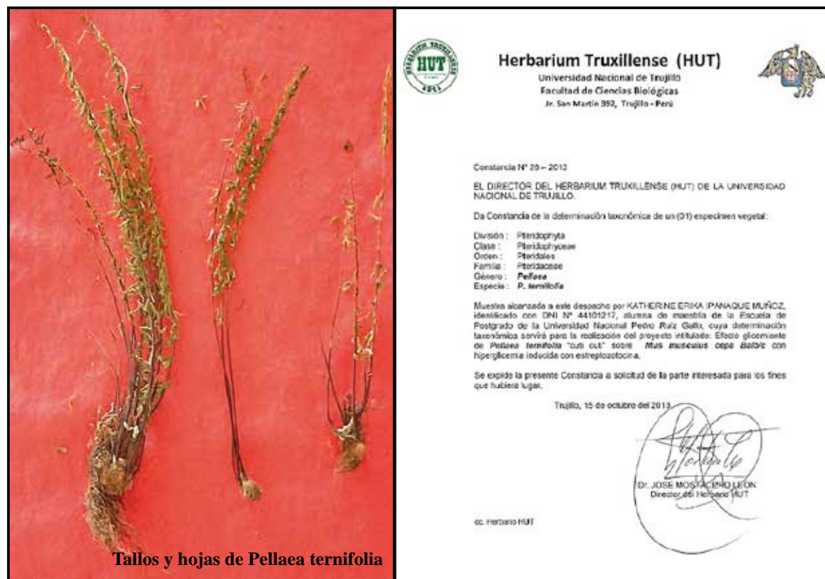
Tallos y hojas de Pellaea ternifolia